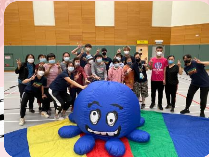
親子Fun Fun 動動樂