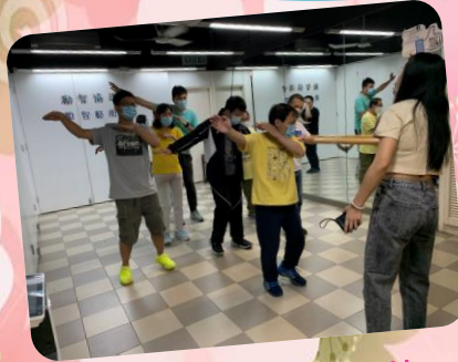
吹夢舞台比賽特訓